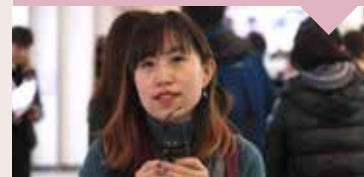
天津美甲店店主 (买家)

“我觉得这个展会办得特别棒, 我喜欢的日本品牌都在这里, 以前我需要朋友在日本代购, 现在在北京美甲博览会就可以采购得到了; 另外, 老师的现场演示, 令我学习了很多东西。希望明年的展会会有更多的国际品牌, 让我好好的选购。”